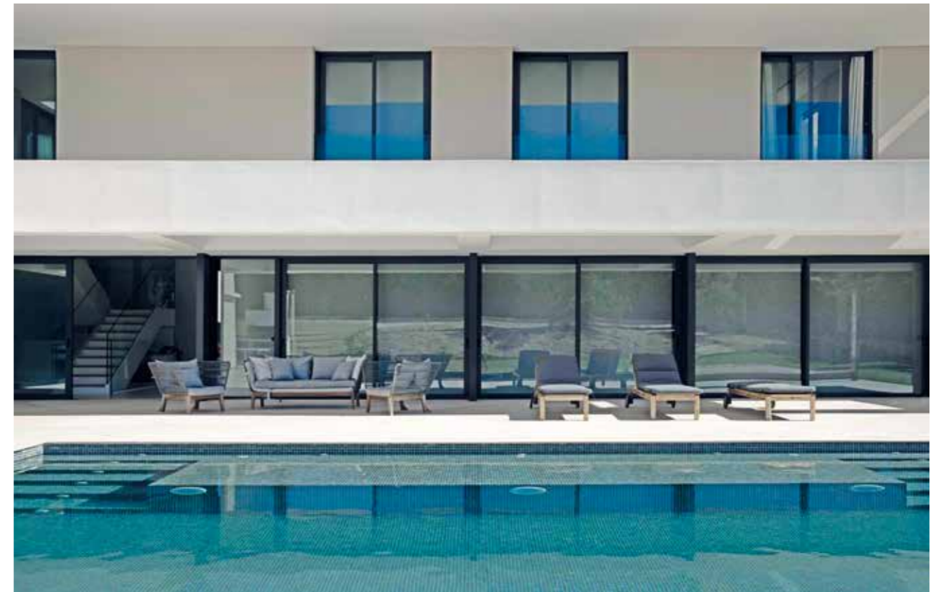
TEXTOS: PAU MONFORT.