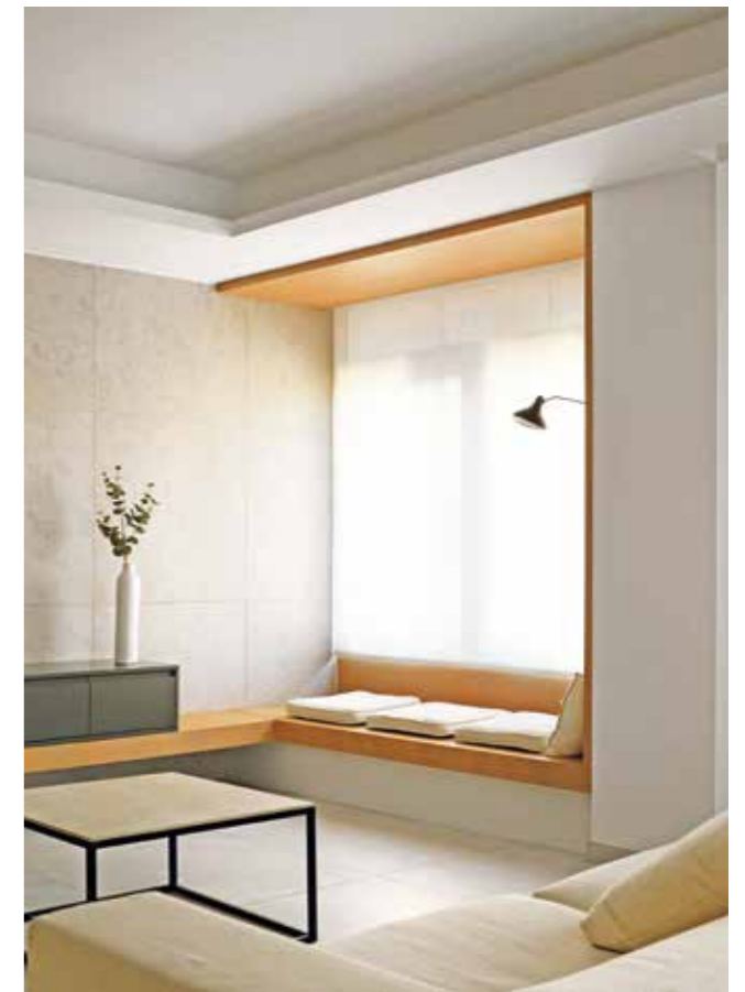
TEXTOS: PABLO ESTELA.

Con más de 165 m2 de superficie, este proyecto cuenta con la peculiaridad de tener dos direcciones, todo un reto que solventar por parte del equipo de arquitectos a cargo del proyecto.